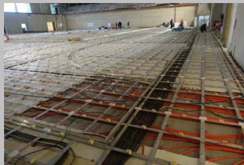
Schwingbodenheizung während der Montage

Das Herzstück der BallsportArena fällt beim Betreten sofort ins Auge: Auf dem ASB Glassfloor tragen die Handballer des HC Elbflorenz ihre Heimspiele aus. Eine Weltneuheit, welche hinsichtlich Funktionalität und Flexibilität keine Wünsche offenlassen dürfte. Die Montage war eine Herausforderung, mussten der Systemhersteller und der Errichter der integrierten Schwingbodenheizung nicht nur schlichtweg Hand in Hand zusammenarbeiten, sondern dabei auf einer Fläche von 1.936 m 2 Toleranzen im 1/10 mm-Bereich einhalten, wie sie sonst nur im Maschinenbau üblich sind.