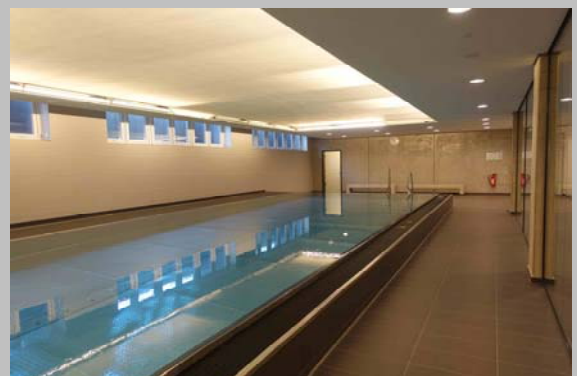
Bewegungsbecken im Untergeschoss