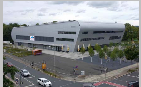
Die neue Ballsportarena

Das Gebäudetechnikprojekt wurde im Rahmen einer ARGE- Planung Gebäudetechnik/ELT unter Leitung von FWU entwickelt und umgesetzt.