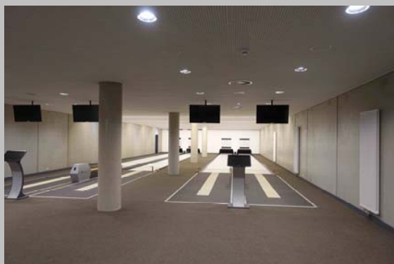
Kegelbahn im Untergeschoss