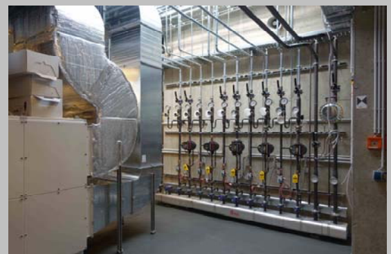
Lüftungszentrale 2 mit Heizungsverteiler

Die Elektroanlage verfügt über 32 Starkstromverteiler, welche unter anderem 1.640 Leuchten versorgen. Es wurden über 100 km Starkstromleitungen und Datenleitungen verlegt.